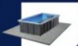
● استخر به صورت کامل روی زمین